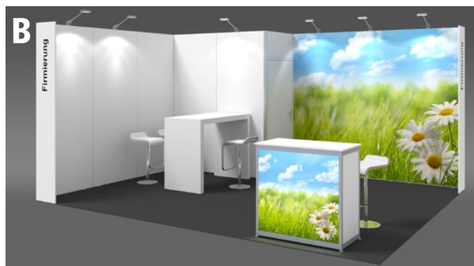
Beispiele: 20-m²-Eckstand | Example: 20 m² corner stand